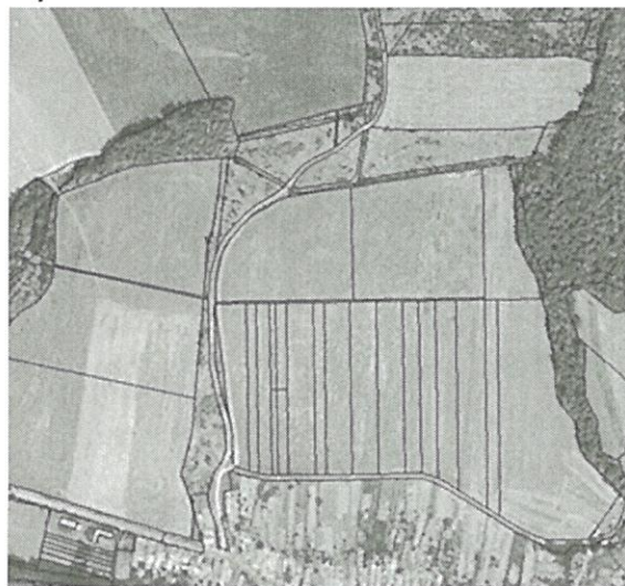
stav po pozemkových úpravách